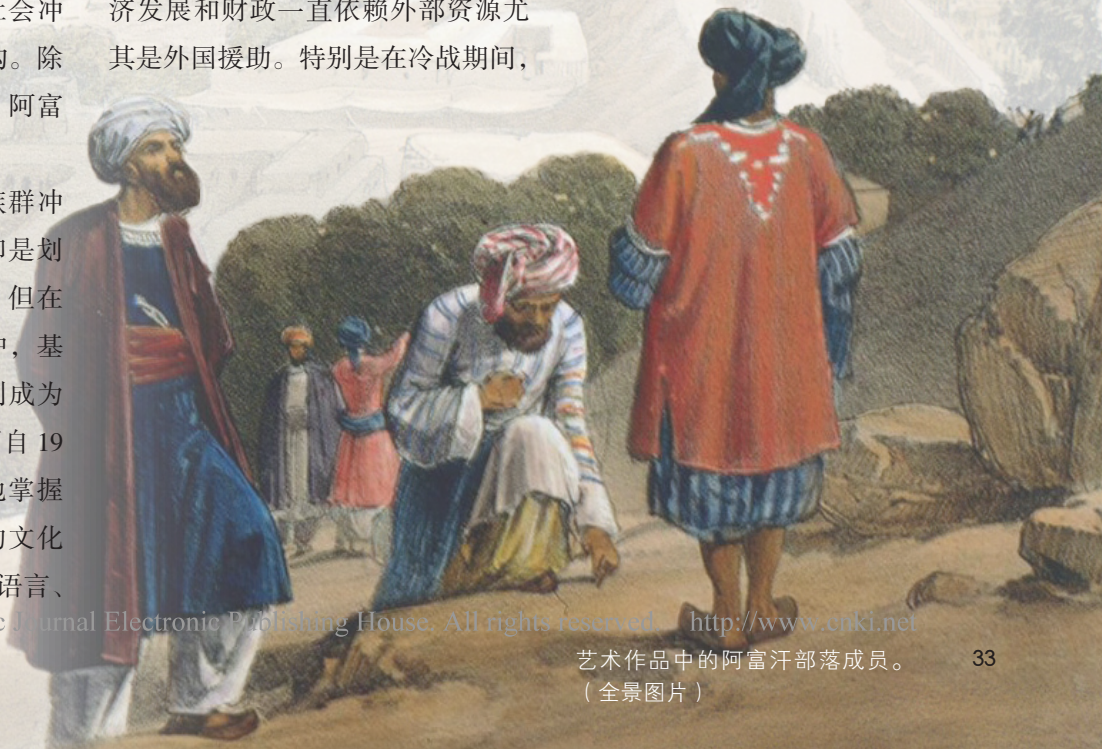
艺术作品中的阿富汗部落成员。 (全景图片)

上述三种身份差异某种意义上是社会建构的结果，并随着社会政治的变化尤其是社会冲突不断强化，他们连同部落和地方认同共同构成阿富汗身份政治的复杂图景。但这些身份差异并非泾渭分明，而是相互交织。宗教认同、社会主义观念中具有明显的部落和族群差异。例如，20世纪后期的政治伊斯兰运动“乌斯塔兹”内部因族群构成的不同分为两派，并最终分裂为伊斯兰促进会（少数民族）和伊斯兰党（普什图族）。受到苏联影响的社会主义