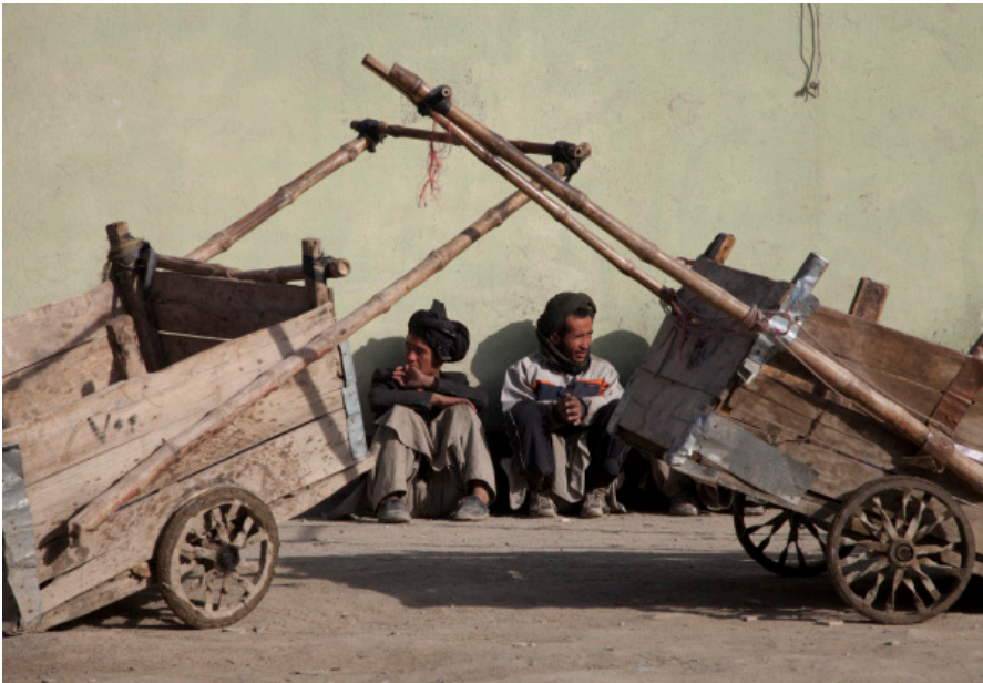
2012年11月，阿富汗最受压迫的群体之一哈扎拉人工作间隙在喀布尔街头休息。

与阿富汗国家的建构之间存在张力。西方国家试图以世俗的自由民主制度超越族群政治，将民主制度移植到阿富汗，建立强总统制的集权制度。尽管阿富汗政府禁止以特定的族群和部落等身份参加选举、组建政党，但阿富汗的西式选举政治还是异化为族群政治。实际上，阿富汗的选举大多是以族群为边界进行的，选民往往选择所属的族群领导人。这进一步加深了社会隔阂，使族群成为阿富汗最重要的政治与社会身份。