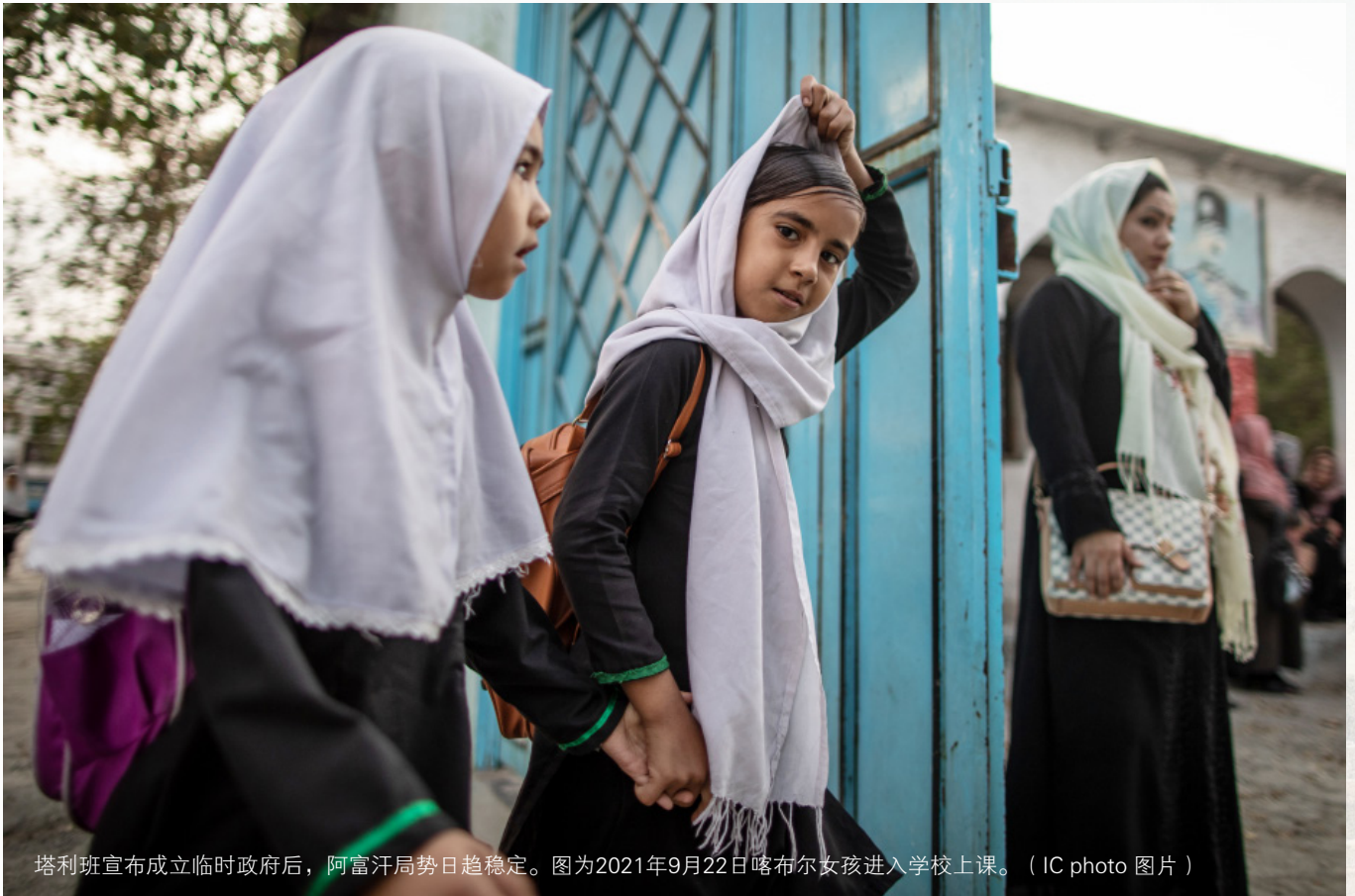
塔利班宣布成立临时政府后，阿富汗局势日趋稳定。图为2021年9月22日喀布尔女孩进入学校上课。

仍依赖部落社会维系和建构王朝统治。在此背景下，部落社会在维持自治的同时，逐渐形成了等级化体制，部落身份成为决定政治权力和行为的关键要素。具体而言，杜兰尼王朝的统治者皆属于普什图族杜兰尼部落联盟，其中以坎大哈为基础的波波尔查伊、巴拉克查伊、阿里克查伊等部落处于统治地位，不仅具有政治特权，还获得大量土地并拥有免税特权，前两者甚至长期垄断阿富汗政权；同属普什图族的吉尔查伊部落联盟处于次等地位，非普什图族的部落则地位低下。但这一时期阿富汗的族群认同十分脆弱，基于特定地域和血缘关系的部落身份处于主导地位。