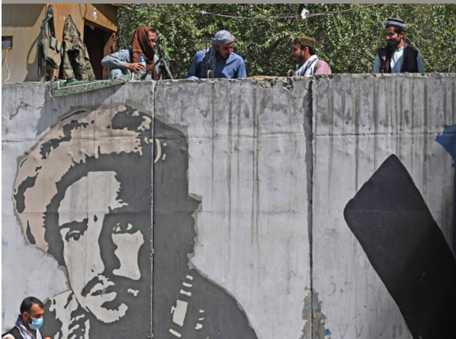
2021年8月28日，塔利班人员坐在喀布尔一面绘有前北方联盟领导人艾哈迈德·沙阿·马苏德头像的水泥墙上。

(C)1994-2021 China Academic Journal Electronic Publishing House. All rights reserved. http://www.cnki.net