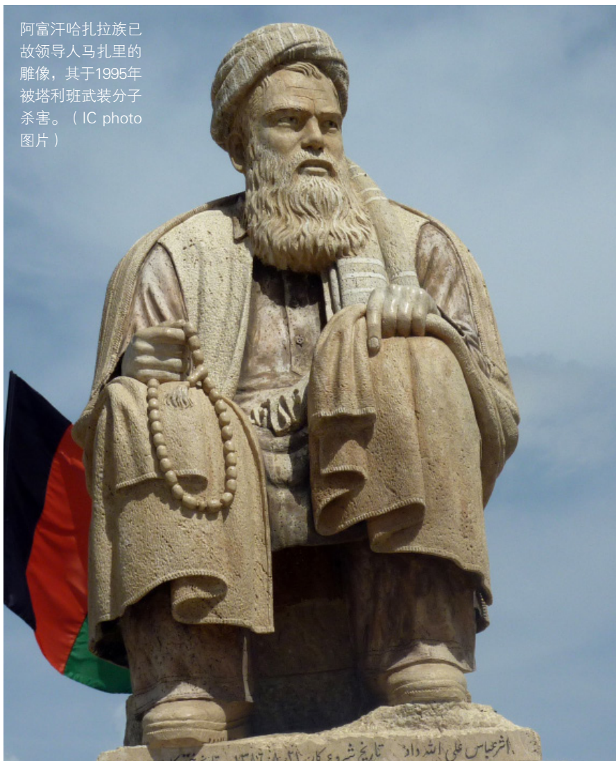
阿富汗哈拉族已故领导人马扎里的雕像，其于1995年被塔利班武装分子杀害。