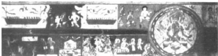
图4 拉达克阿尔奇寺壁画所见二船图*

似乎有类似二船图的图案（图4），故而克林凯特推定这些可能和摩尼教有关。 ① 马小鹤、张忠达也认为佛教虽亦用船来象征渡过苦海，但用两条船来形容，实所罕见。这条船上所绘船夫带着一班乘客，当是受到摩尼教的启发。 ②