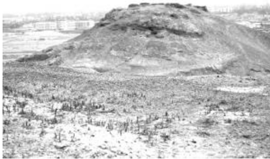
图1 吐鲁番布拉依克景教寺院遗址

典者,如在吐鲁番布拉依克景教寺院遗址(图1)即曾见之, ① 而摩尼教的官方语言通常为帕提亚语、科普特语和阿拉美语(古叙利亚语),然其在东方传教中亦大量采用粟特文、回鹘文、叙利亚语文来传写其经典, ② 是故两者在中亚传播之中当多有交往。相对于公元前即已播教中亚的佛教与祆教,以及公元3世纪王公贵族虔信并编译大量经典的摩尼教,景教这个姗姗来迟的外来户显然处于劣势。 ③ 故而入中亚之后的景教,大量吸取摩尼教、祆教和佛教的教义和语汇。贞观年间入华后,面对强势的佛教、道教,景教更不得不刻意放低身段,积极靠拢,将上帝、基督改头换面成天尊和佛世尊。当摩尼教于安史乱后在中国大行其道后,景教虽未攀附摩尼教,但亦同样积极吸收部分摩尼教语汇,今在敦煌发现的六篇唐代景教经文及在西安、洛阳发现的唐代石刻中亦可见蛛丝马迹。 ④