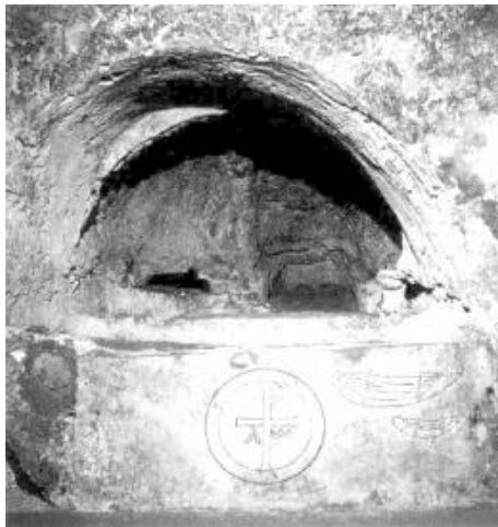
图 2 意大利锡拉库萨主教墓龛*