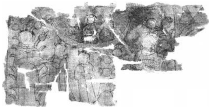
图3 吐鲁番出土摩尼教绘画中的方舟*

* 图片转引自 A. von Le Coq, Chotscho: Facsimile-Wiedergabe der Wichtigeren Funde der ersten Königlich Preussischen Expedition nach Turfan in Ost-Turkistan , Berlin: Dietrich Reimer, 1913, Tef. 2b。